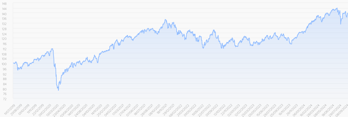
● Fineco AM Advisory 9